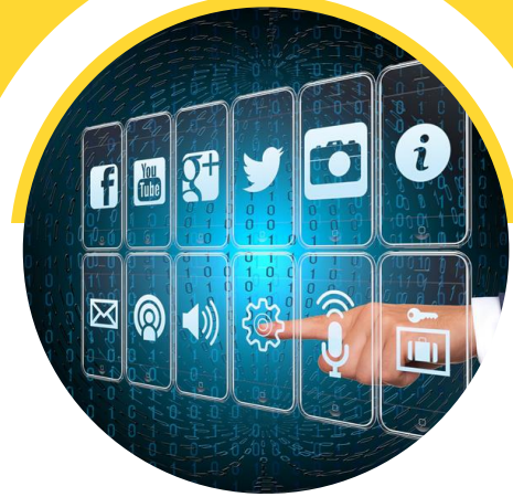
Marketing y comunicación