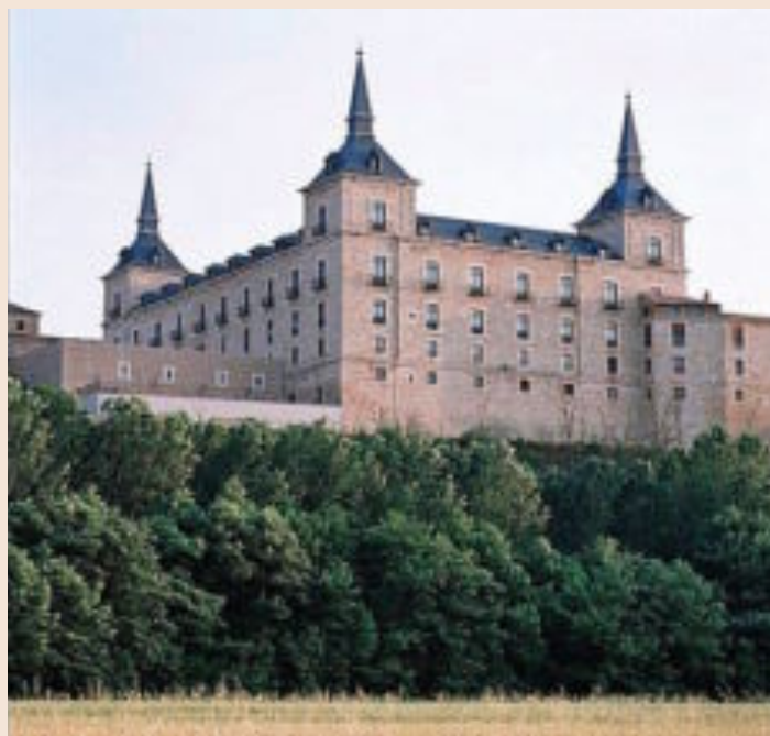
Palacio Ducal de Lerma, uno de los establecimientos de Paradores.