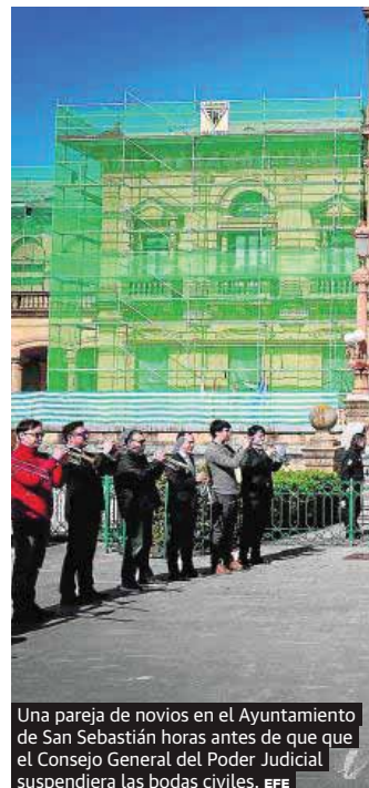
Una pareja de novios en el Ayuntamiento de San Sebastián horas antes de que el Consejo General del Poder Judicial suspendiera las bodas civiles.

No, puesto que el decreto ley aprobado no dice nada al respecto. Así, el teletrabajo es voluntario, aunque se trata de una medida muy interesante para evitar el riesgo