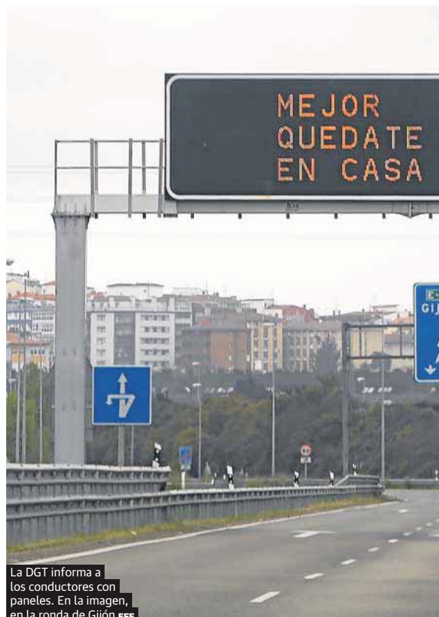
La DGT informa a los conductores con paneles. En la imagen, en la ronda de Gijón