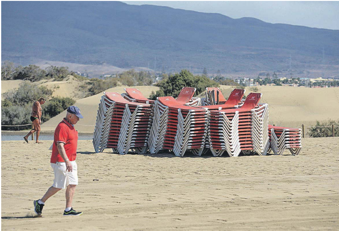
Un turista pasea frente a las hamacas recogidas en la playa de Maspalomas.