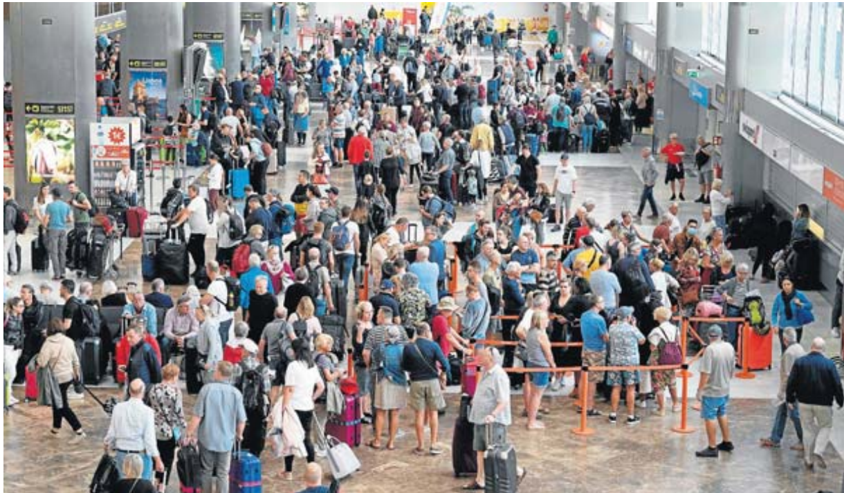
Imagen del hall de Salidas del aeropuerto de Tenerife Sur, donde cientos de turistas esperaban ayer para coger los vuelos con los que pensaban regresar a sus países de origen

Los hoteleros agradecen que no se les ordenara cerrar de inmediato para poder esperar a que vayan saliendo los clientes que tienen alojados. Un grupo de canarios se quedó tirado en la península al cancelarse un vuelo desde Málaga