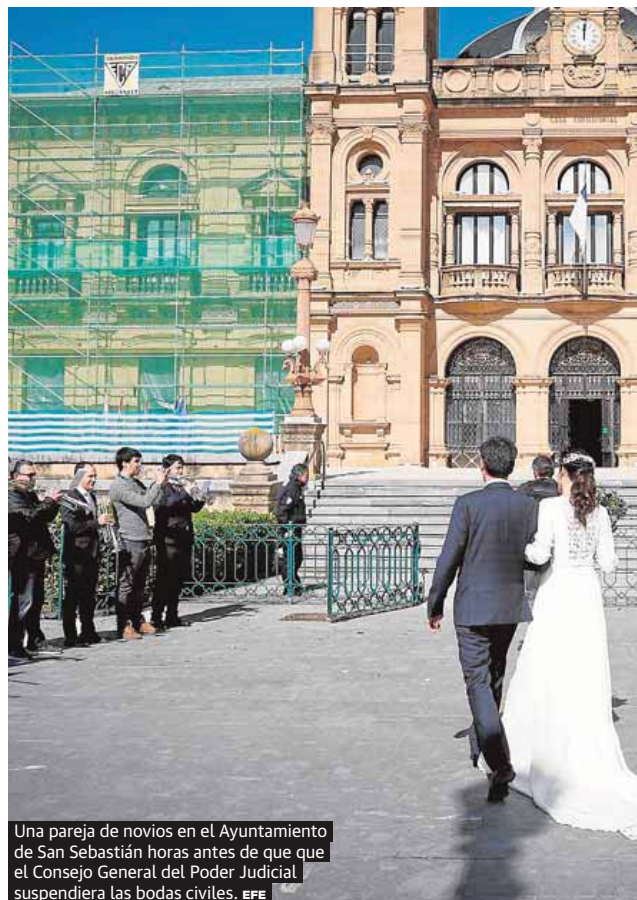
Una pareja de novios en el Ayuntamiento de San Sebastián horas antes de que el Consejo General del Poder Judicial suspendiera las bodas civiles.

No, no cabe obligarte a cogerte dichos días a cuenta de vacaciones.