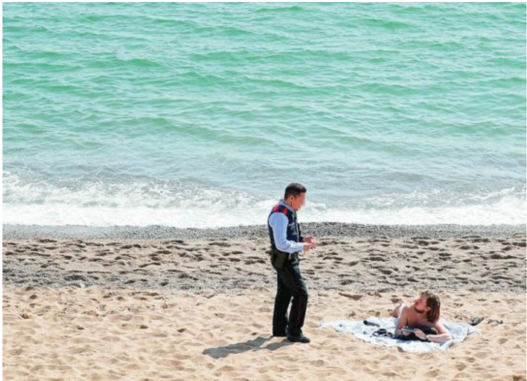
Un Mosso informa a una persona de las prohibiciones derivadas del estado de alerta, ayer, en Barcelona