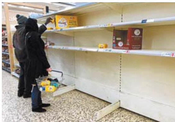
Consumidores ante los estantes de un supermercado británico.