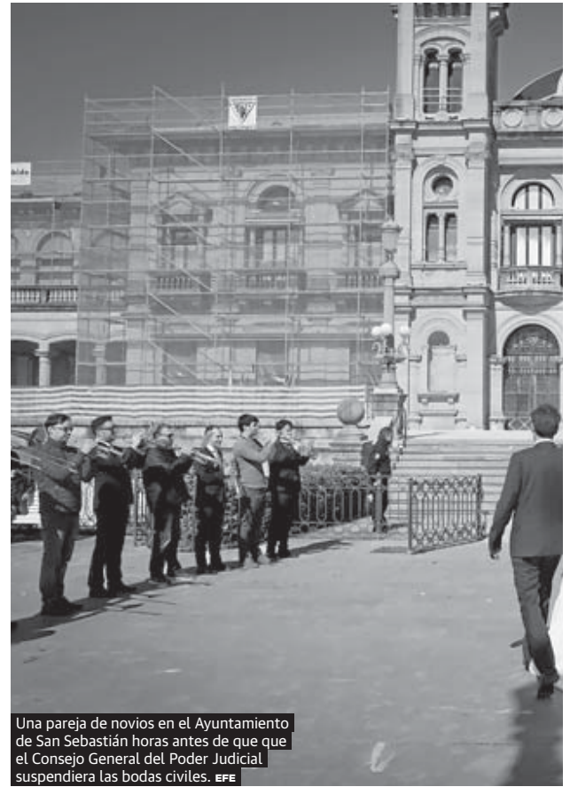
Una pareja de novios en el Ayuntamiento de San Sebastián horas antes de que el Consejo General del Poder Judicial suspendiera las bodas civiles.