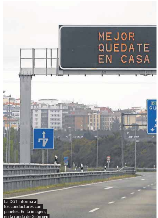
La DGT informa a los conductores con paneles. En la imagen, en la ronda de Gijón