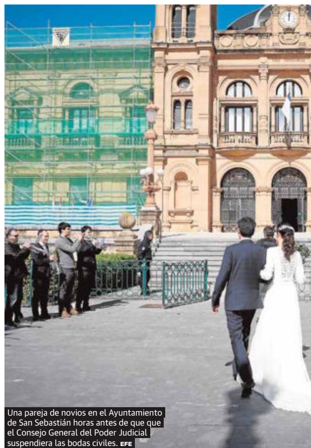
Una pareja de novios en el Ayuntamiento de San Sebastián horas antes de que el Consejo General del Poder Judicial suspendiera las bodas civiles.

No, no cabe obligarte a cogerte dichos días a cuenta de vacaciones.