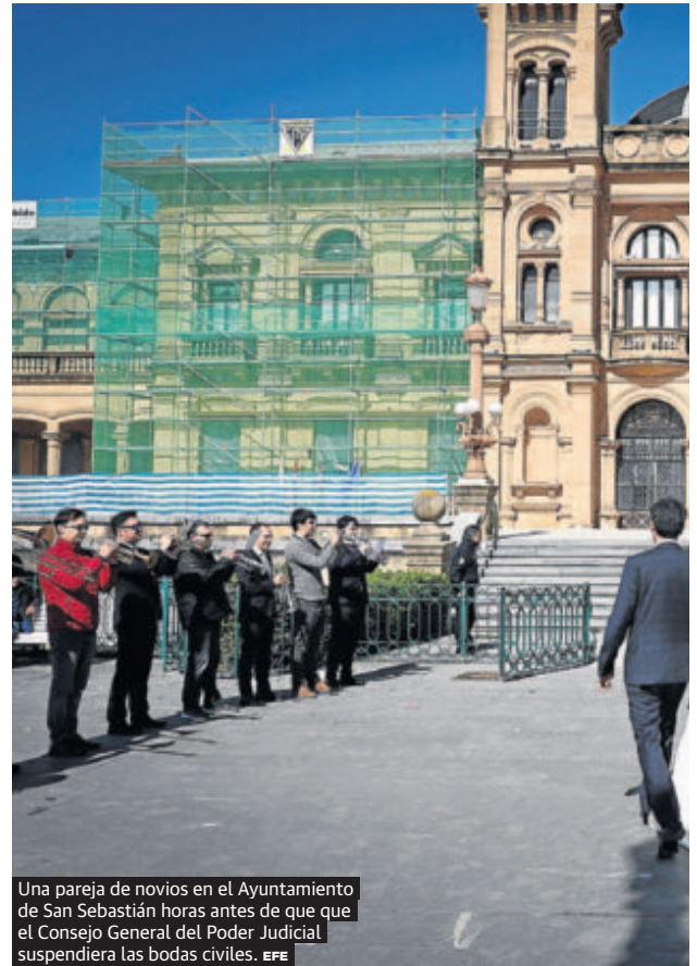
Una pareja de novios en el Ayuntamiento de San Sebastián horas antes de que que el Consejo General del Poder Judicial suspendiera las bodas civiles.